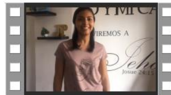
VIDEO SEMANA 2 CUARENTENA ESTUDIANDO EN CASA1.mp4

Entre semana se mantuvo comunicación constante con los chicos enviándoles videos explicativos de las actividades a desarrollarse que inician con reflexiones. También se les hicieron llamadas acompañándolos en el proceso. El día jueves debido a que el viernes era festivo se recibieron la mayoría de